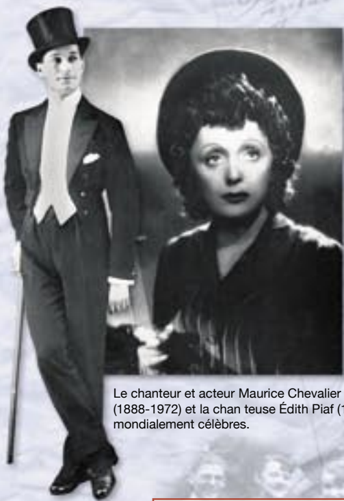
Le chanteur et acteur Maurice Chevalier (1888-1972) et la chanteuse Édith Piaf (1915-1963), mondialement célèbres.

Une méga réunion de famille, passionnante à organiser, et qui laissera de formidables souvenirs à tous ses participants (qui se comptent parfois par centaines).