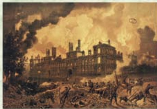
Le 24 mai 1871, l'incendie de l'Hôtel de Ville de Paris, de l'annexe avenue Victoria et du Palais de Justice entraînèrent la disparition intégrale de l'état civil parisien antérieur à 1860.