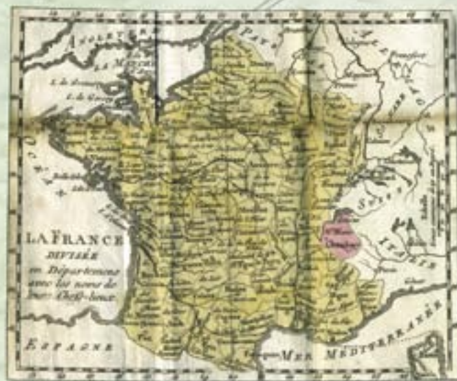
La Savoie, pour n'avoir été rattachée à la France qu'en 1860, ne verra son état civil débiter qu'à cette époque...

choisissez une branche facile à travailler, c'est-à-dire à la fois proche de chez vous et en dehors des cas particuliers.